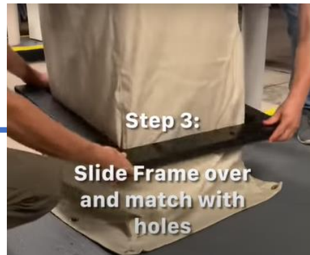
ブラケットをかぶせる