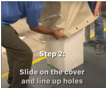
シートをかぶせる