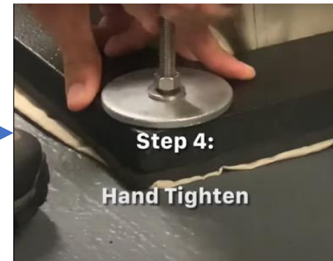
ボルトで固定する